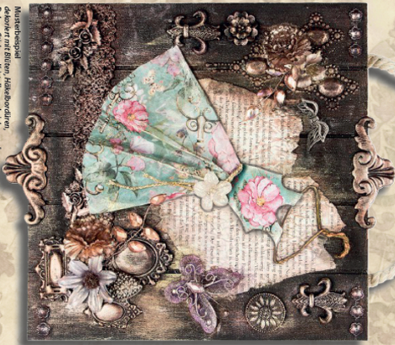
Mustereispiel dekoriert mit Blüten, Hakenbördchen, Deluxe-Stickern, Kristallen und vielem mehr.

Den Rock und ein beliebiges Oberenteil auf ein dekoratives Papier übertragen und ausschneiden. Das Oberenteil an den gestrichelten Linien falten, zum Beispiel über einen kleinen Drahtbügel legen und an gewünschter Position auf dem vorbereiteten Untergrund festkleben. Den Rock an den gestrichelten Linien falten und zusammenschieben, bis die Taillenbreite des Oberteils erreicht ist; platzieren und auf dem Untergrund fixieren.